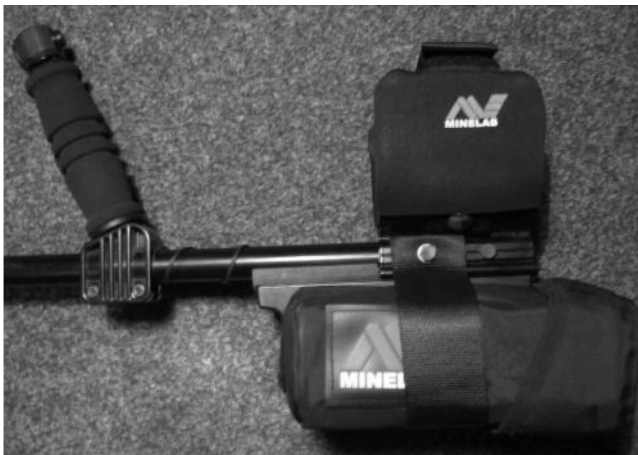
SIDE VIEW – WIDOK Z BOKU