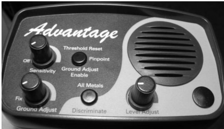
PLUGS IN THE HOLES AFTER THE SWITCHES REMOVAL – ZATYCZKI W OTWORACH PO USUNIĘCIU PRZEŁĄCZNIKÓW