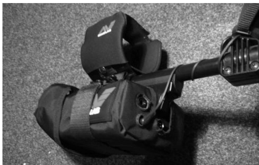
ADDITIONAL SOCKET FOR CONNECTING THE SWITCH IN THE HANDLE - DODATKOWE GNIAZDO DO PODŁĄCZENIA PRZEŁĄCZNIKA W RĄCZCE